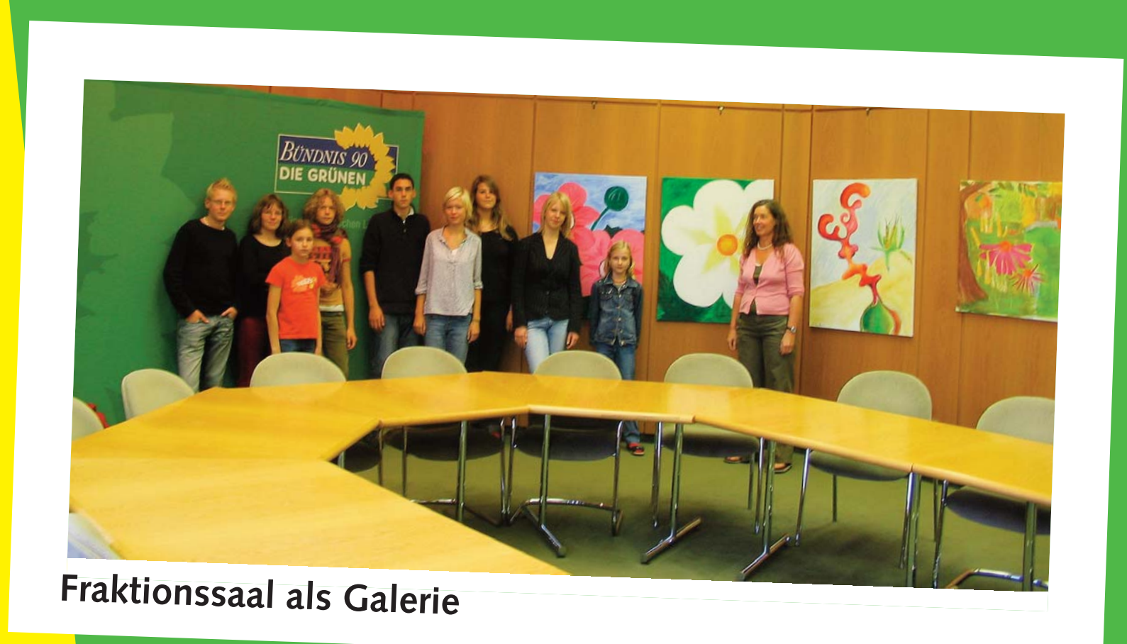
Fraktionssaal als Galerie