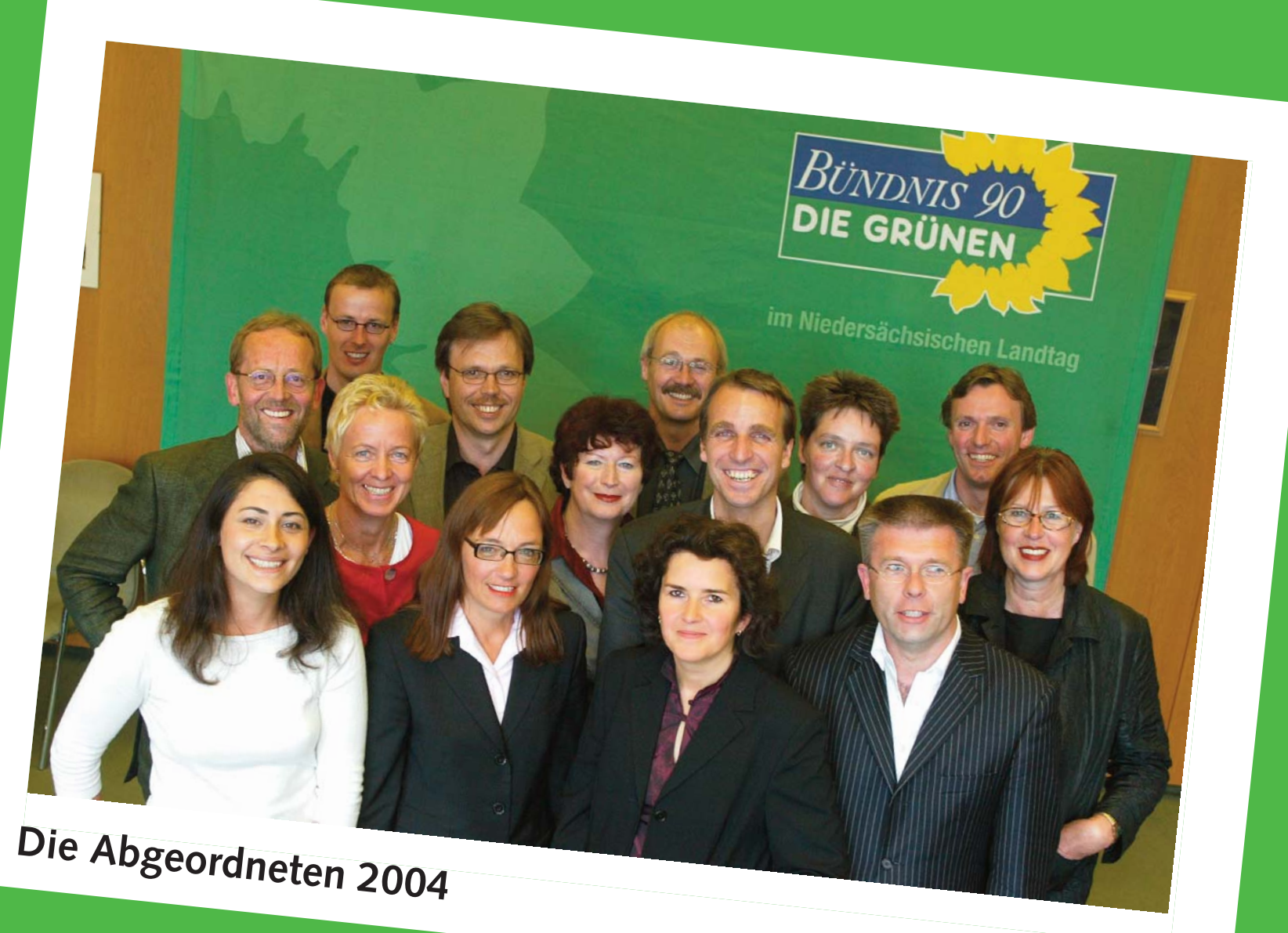
Die Abgeordneten 2004