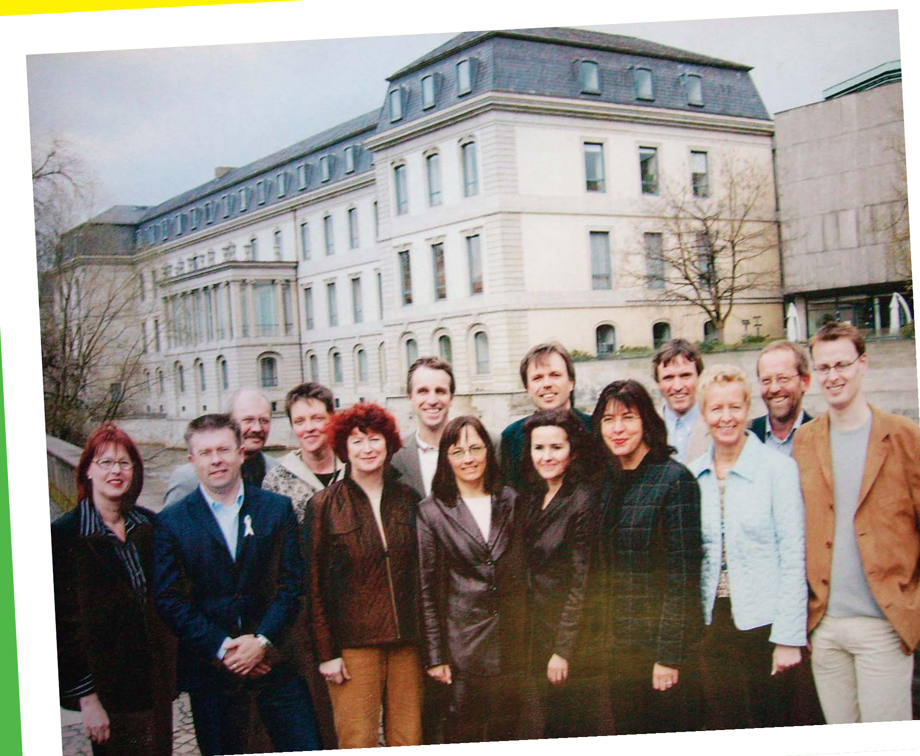
Grüne Abgeordnete 2003 vor dem Landtag